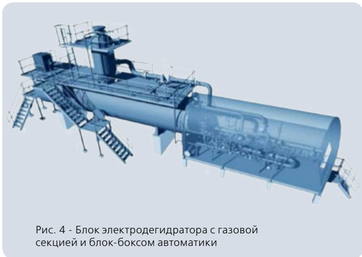
Рис. 4 - Блок электродегидратора с газовой секцией и блок-боксом автоматики