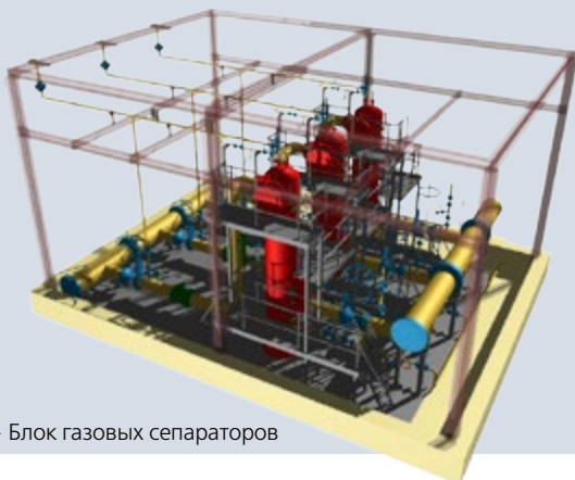
Рис. 1 - Блок газовых сепараторов